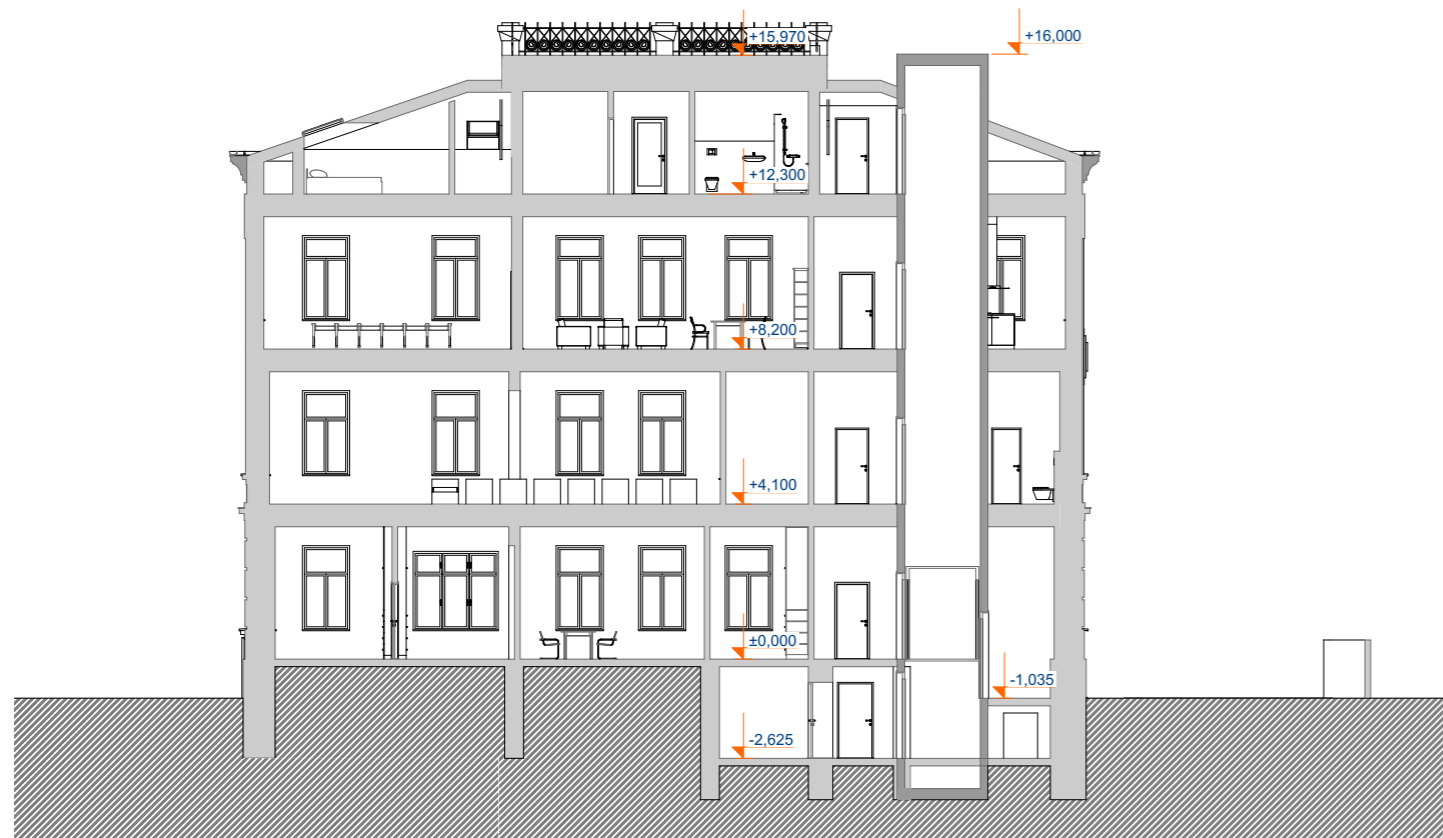
Řez výtahovou šachtou - nový stav